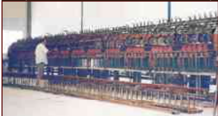
Maquina hiladora de Manufacturas fabricada en Belfast (Irlanda del Norte), salvada por el Museo de su destrozo, actualmente en un almacén municipal

Fueron negros los heraldos / que anunciaron esa muerte de perdidas ilusiones / que esperaban mejor suerte. Mis manos están heridas / con versos duros de esparto goteando sangre dolida / envuelta en oscuro manto. (PATRICIA BENAVENTE)