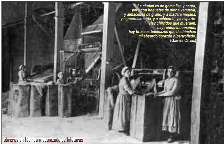
obreras en fábrica mecanizada de hilaturas

Paralelamente a la industria manual del esparto, también se desarrollaría en Cieza a partir de la segunda década del siglo XX, con objeto de mejorar la calidad de la mercancía y diversificar las aplicaciones del esparto, un proceso de mecanización de la industria espartera para la fabricación mecánica de hilaturas a través de máquinas hiladoras, las primeras de las cuales fueron importadas de Inglaterra, máximo exponente de la industria textil de aquellos años.