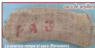
La avaricia rompe el saco (REFRANERO)

Más vale una mujer hilando que cinco mirando (REFRANERO)