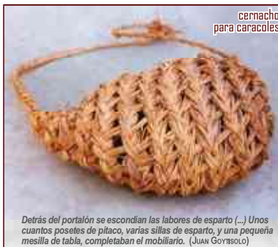
cernacho para caracoles

Aunque la mayoría de los enseres de esparto se realizaban en pleita , había otros que se elaboraban empleando sistemas de trenzado distintos, entre los que cabe destacar el punto de capacho , el cernacho , el recincho , el filete y la líá .