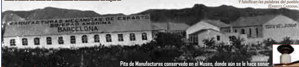
Pito de Manufacturas conservado en el Museo, donde aún se le hace sonar

Le saquean al pueblo su lenguaje. Y falsifican las palabras del pueblo. (ERNESTO CARDENAL)