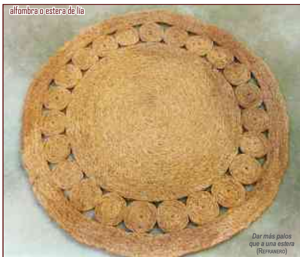
alfombra o estera de lía

Las esteras tuvieron diversos Usos domésticos en el ámbito rural, sirviendo incluso de lecho en sus orígenes. A lo largo de los años la imaginación popular