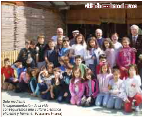
visita de escolares al museo

Hilando, hilando, la vida se va pasando (REFRANERO)