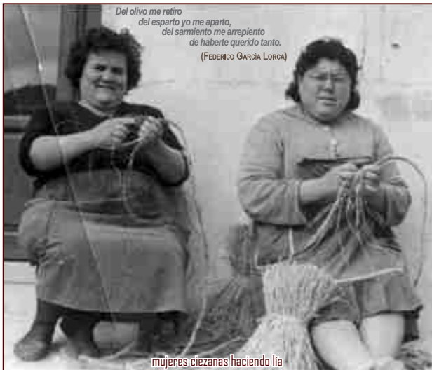
Del olivo me retiro del esparto yo me aparto, del sarmiento me arrepiento de haberte querido tanto. (FEDERICO GARCÍA LORCA)