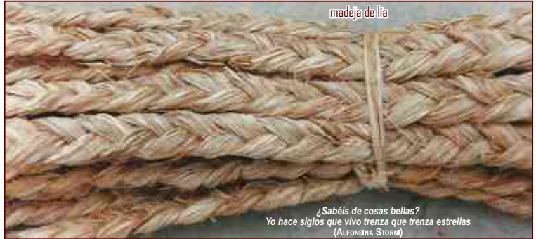
¿Sabéis de cosas bellas? Yo hace siglos que vivo trenza que trenza estrellas (ALFONSIÑA STORNI)

La LÍA es trenza de tres ramales de esparto cocido y picado. Era una faena manual tradicionalmente doméstica que, dadas sus múltiples aplicaciones, fue comercializada por pequeños y grandes fabricantes, dando lugar a un trabajo asalariado que fue desempeñado principalmente por mujeres de todas las edades.