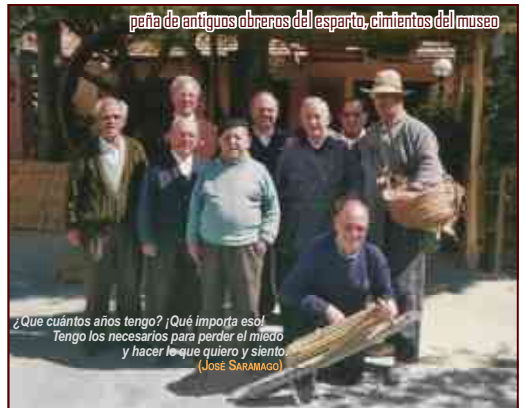
peña de antiguos obreros del esparto, cimientos del museo

Solo mediante la experimentación de la vida conseguiremos una cultura científica eficiente y humana. (CELESTINE FRENET)