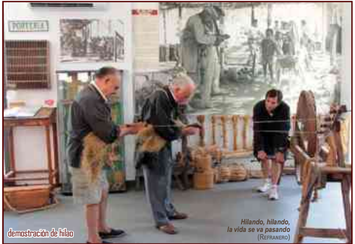
demonstración de hilado

diversos trabajos esparteros: desde observar y tocar la propia planta de esparto ( atocha ), los utensilios y herramientas empleados en los distintos trabajos, los variados trenzados y enseres de uso doméstico y agrícola, hasta ver cómo se elaboran estropajos para la limpieza mediante maquinillas de tracción manual y, especialmente, presenciar demostraciones de hilado con rueda para fabricar cuerdas , confeccionadas a la vieja usanza por antiguos hilaos , unos verdaderos maestros del oficio, hoy salvaguardas y difusores de la cultura del esparto , que aquí en este Museo reencontraron el reconocimiento humano de sus saberes que la sociedad les negó en su momento.